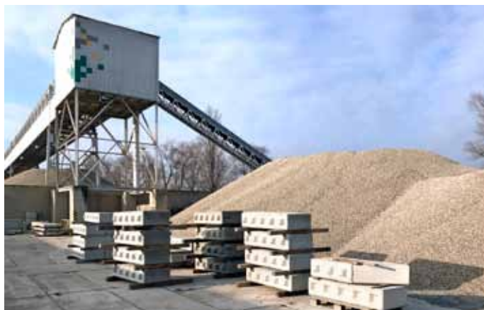
Betonbloky TBG jsou ze 100 % vyrobeny z kvalitního recyklovaného materiálu