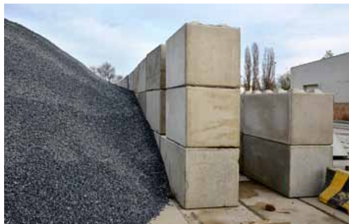
Realizace – dělicí zídka pro skládkování kameniva