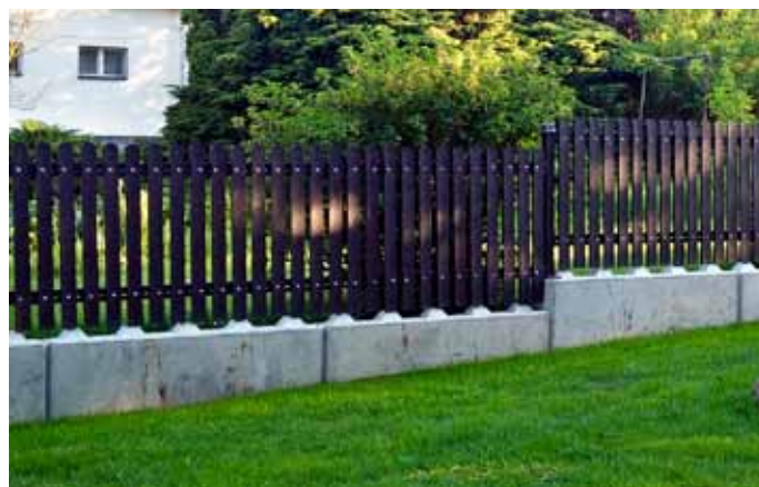
Základ pod plotem